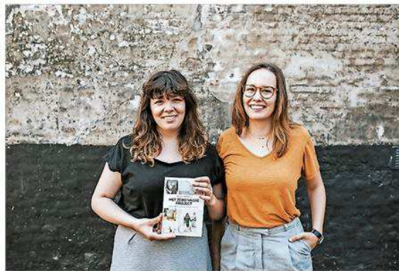
Door de 5 R's te volgen bereik je een leven zonder afval.

Al het afval dat je na deze stappen nog over hebt, recycle je. Je probeert de hoeveelheid afval die je recycleert dus zo klein mogelijk te houden. Tenslotte probeer je zoveel mogelijk van je groene afval te composteren, bijvoorbeeld in je eigen wormenhotel."